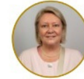
Zelda Dalling Infrastructure