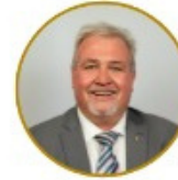
Rikus Badenhorst Protection Services