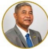
Ralphton Adams Youth, Sport and Culture