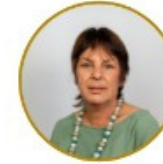
Rozette du Toit Local Economic Development and Tourism