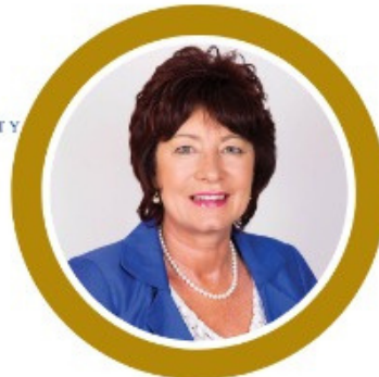
Gesie van Deventer Executive Mayor